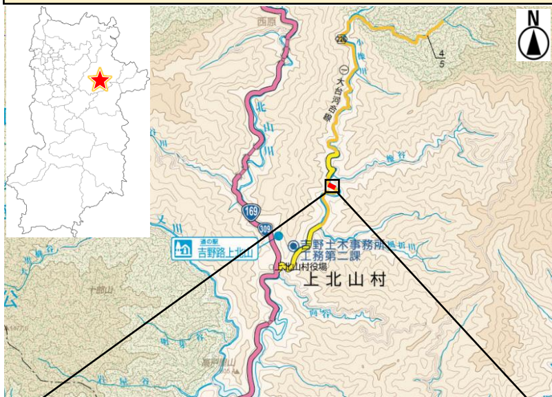
「国土地理院発行の10万分1地形図を複製」