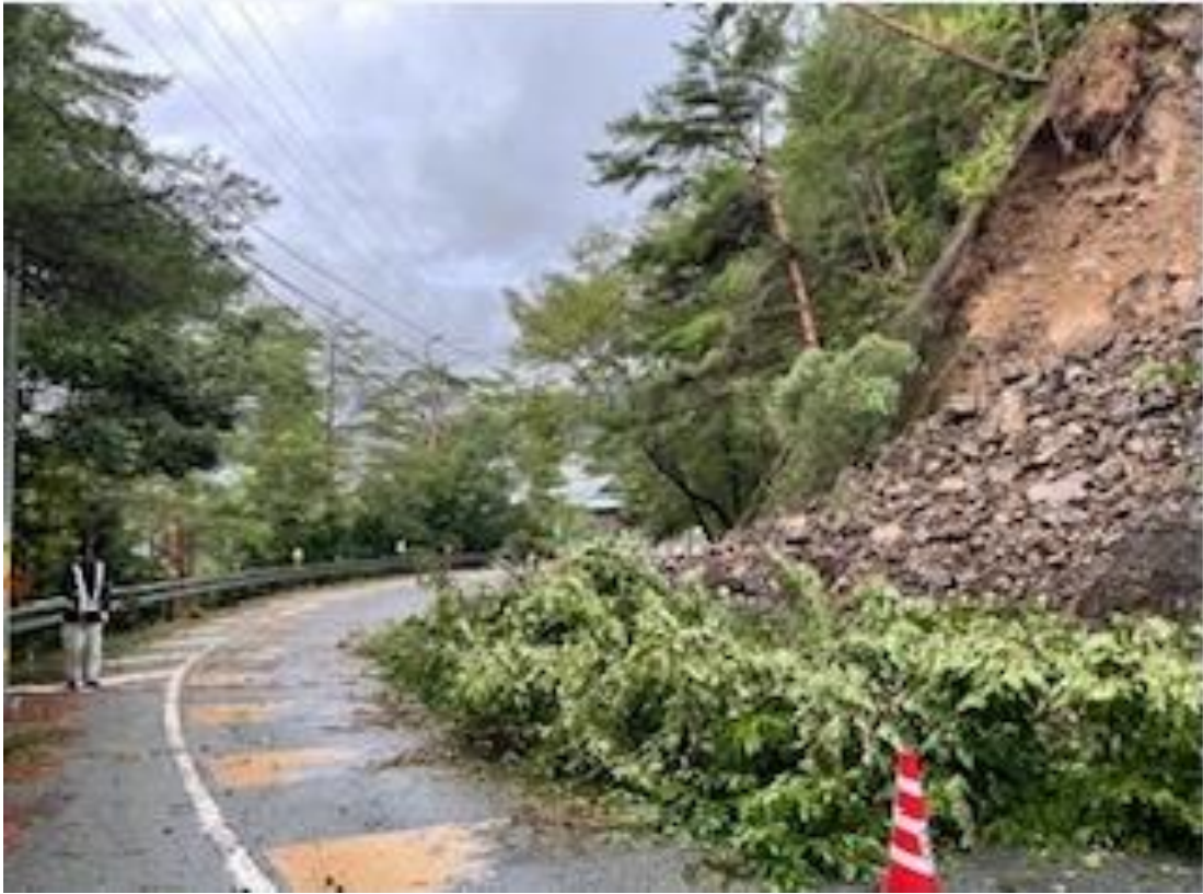
①国道168号崩土現場写真