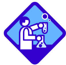
別表 補助対象経費