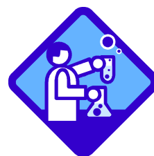
別表 補助対象経費