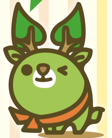
奈良県エコキャラクター な～らちゃん