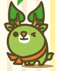
奈良県エコキャラクター な〜らちゃん