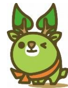
奈良県エコキャラクター な～らちゃん