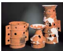
東殿塚古墳の埴輪 天理市教育委員会蔵

1/20(土)～3/3(日) 所 文化財修復・展示棟 これまでの調査成果を通じて、天理市の古墳時代を代表する大和古墳群・柳本古墳群を紹介します。