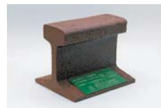
大阪鉄道亀瀬隧道 レール切片

開催中～1/14(日) 一般 400(350)円 大・高生 300(250)円 中・小生 200(150)円 奈良の鉄道の歴史と役割について考古学の視点から迫ります。