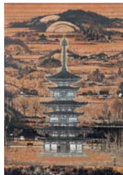
不染鉄《業師寺東塔之図》 昭和40年代頃 小石川 源覚寺蔵

1/13(土)～3/10(日) 一般 1,200(1,000)円 大・高生 1,000(800)円 中・小生 800(600)円 不染鉄の初期から晩年までの代表作による6年ぶりの回顧展を開催します。