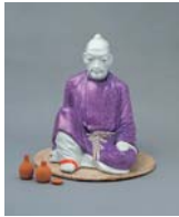
大有田焼振興協同組合 《万葉歌人陶磁器人形 大伴旅人像》

万葉集を代表する7人の歌人にスポットをあて、当館のコレクションを紹介いたします。