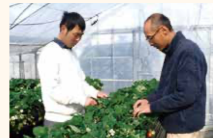
2年次は進路にあわせ、農家現地実践実習か校内プロジェクト実践実習かを選ぶ