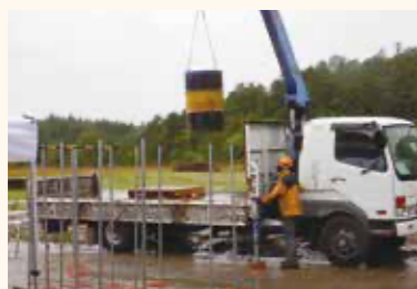
小型移動式クレーン技能講習