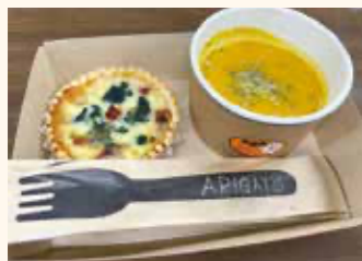
NAFIC産の野菜を使ったメニュー