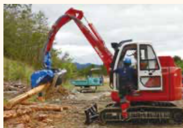
車両系伐採機械特別教育