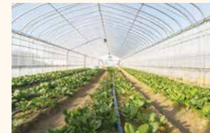
初年次の専門実習では、農業経営の基礎的技術を幅広く身につける