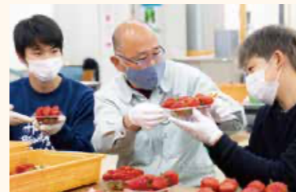
消費者ニーズ販売実習や公開販売では、実際に出荷から販売まで行う