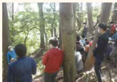
地域森林植生の原点を知る