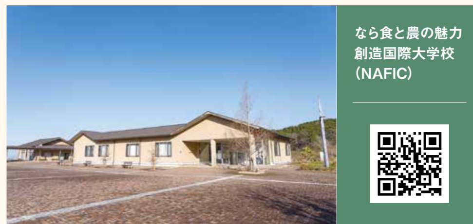
なら食と農の魅力 創造国際大学校 (NAFIC)