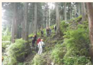
災害リスクを考慮した施業とは

フォレスターアカデミーのカリキュラムの特徴は、林業に関する技能だけでなく、森林環境管理全般について学べる点にある。 近年、林業の振興や、森林の荒廃などが課題となっている。求められているのは、持続可能な林業や、森林環境管理における専門家だ。学生は林業機械技術や森林経営などの林業に関するだけでなく、幅広い分野を学ぶ。防災や生物多様性の保全について学び、レクリエー