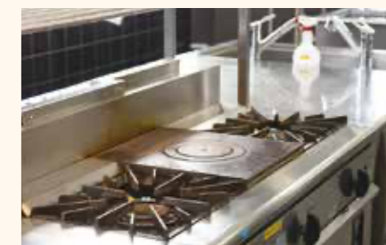
1人1ストーブ(コンロ)方式で、準備から片づけまでの全工程が身につく