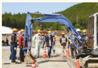
車両系建設機械技能講習