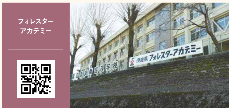
フォレスター アカデミー