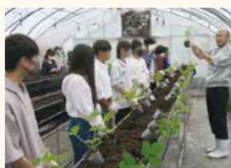
オープンキャンパス(フードクリエイティブ学科)

毎年秋に開催されているNAFIC祭は学科ごとの成果を発表する年1回のイベント。毎年人気で、販売する創作料理、野菜等の農産物はすぐに完売するものも。