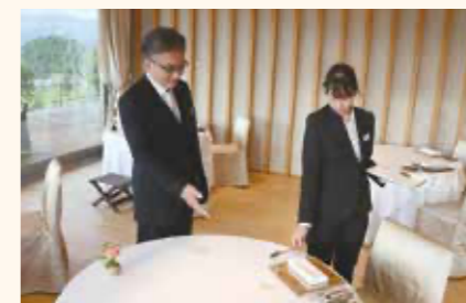
オーベルジュ実習で、お客様を相手に料理の提供やサービスを体験する