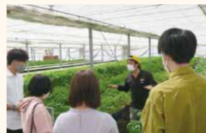
農業基礎・農業実習で、食材に対する知識を深め、生産者の考えや想いを知る

調理に使用する農作物の知識を深めるべく、畑で野菜の種まきから収穫までを体験し、農作物の旬や品種の違いなどを学ぶカリキュラムが全国的にも珍しい。ミシュランガイド奈良2023に一つ星として掲載されたオーベルジュでの調理や、接客サービスに携わる実習の他、外部の専門家によるマーケティングや経営マネジメントの講義など、実践重視のカリキュラムとなっている。