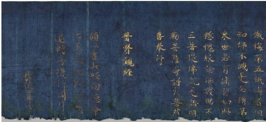
藤原道長筆 観普賢経卷末 長徳四年奥書

道長願経は元禄4年(1691)出土と伝えられ、師通願経も明治時代の神仏分離以前に出土したと推測される。これらは各所に分蔵されているが、本経は、200紙という最大の点数を誇り、経軸や経帙も含まれており我が国の文化史研究上、極めて価値が高い。(平安時代・10～11世紀)