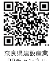
奈良県建設産業PRチャンネル