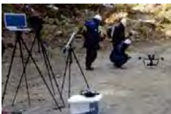
▲ドローン等による3次元測量