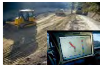
▲ICT建設機械による施工