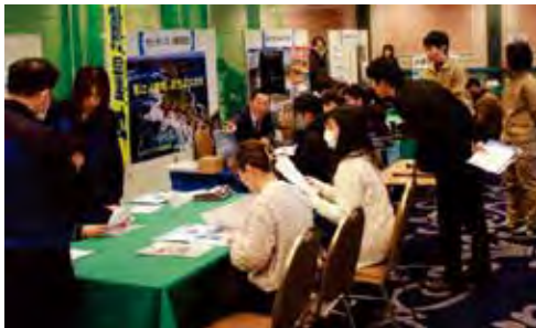
▲建設業就職フェア

また、働き方改革の実現に向けて、県発注の建設工事において、週休2日の導入・普及に取り組んでいます。