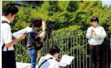
▲建設業の魅力発信動画の撮影風景