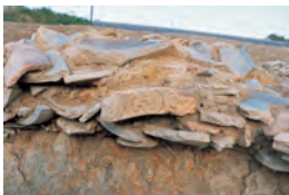
軒平瓦出土状況(若草伽藍跡推定地)

話題となった舟塚古墳や法隆寺周辺遺跡(若草伽藍跡推定地)などの出土品の展示や発掘調査成果を紹介します。