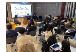
ならイノベーション・キャリアカフェ