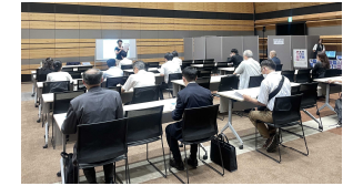
求職者セミナーの開催