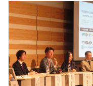
わくわくWORKフェスティバル