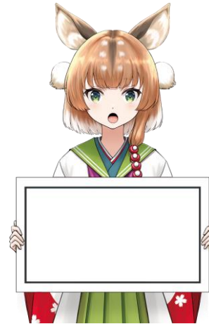
15-04.パネル / 驚き