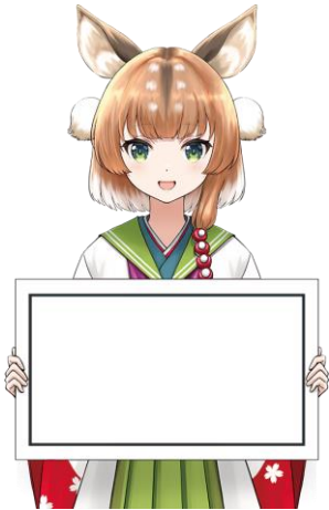
15-01.パネル / 基本