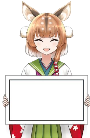
15-02.パネル / ハッピー