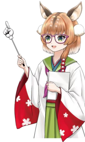
14-02.指差し棒 / 眼鏡