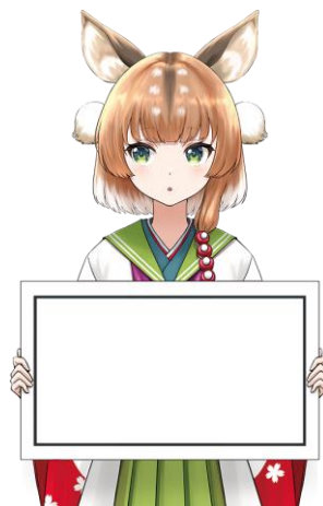
18.パネル／なんだろう？