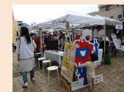
R6.10.27 生駒市 くらしのブンカサイ in 生駒