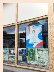
じゅうだテラス (バナーフラッグ)