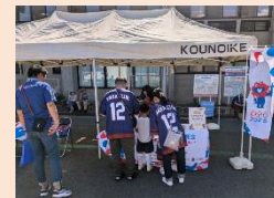
R6.10.13 奈良クラブ対FC大阪