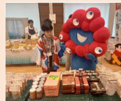
R6.7.1-2 大阪・関西万博 西日本マルシェ