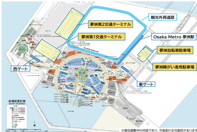
【大阪・関西万博 来場者輸送具体方針（アクションプラン）第4版より抜粋】

○ 団体バス利用 乗降場所：夢洲第2交通ターミナル バス待機場：舞洲万博P&R駐車場