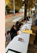
R6.11.24 安堵町 安堵町産業フェスティバル