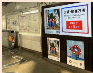
新大宮駅 (デジタルサイネージ、ポスター)