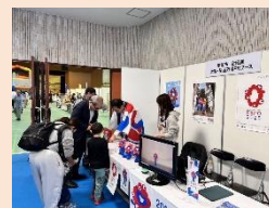
R6.10.26-27 宇陀市 うだ産フェスタ2024