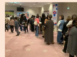
R6.11.16 日本女性会議2025橿原プレ大会