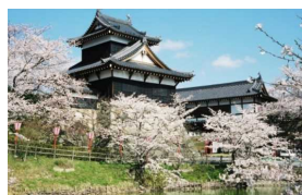
史跡郡山城跡でのお城まつり

近鉄郡山駅周辺では、自動車や歩行者の動線が錯綜しているほか、駅前に送迎スペースがないなど、交通処理機能に課題を抱えています。このため、 駅舎の移設を含む駅周辺整備事業を推進 し、歩行者の安全確保や駅利用者の利便性向上を図ります。また、 駅空間高度化機能施設として「観光交流拠点」「シェアサイクル・カーシェア機能」を整備 することで、駅と周辺の観光施設を結び、近鉄郡山駅の魅力を高めていきます。