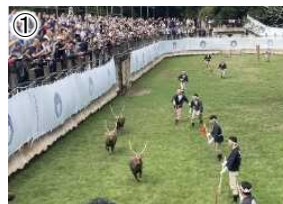
鹿の角きり [秋を彩る奈良の伝統行事]