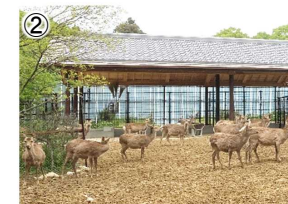
鹿の給餌施設 (R5整備箇所)