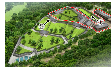
飛火野周辺地区（鹿苑）整備イメージ