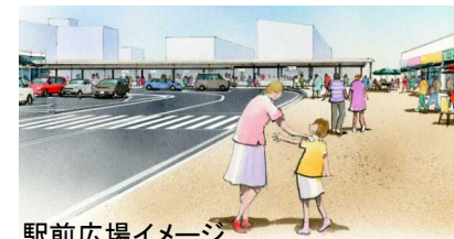
駅前広場イメージ

●令和12年度中の新駅供用開始を目指し、橿原市や近鉄と連携して、取組を推進しています。