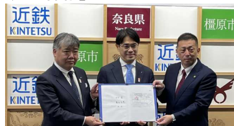
(近鉄社長、奈良県知事、橿原市長)

新駅の設置に関し、奈良県、橿原市、近鉄で、費用負担や役割分担といった基本事項について合意に至り、令和7年3月28日に基本協定を締結しました。