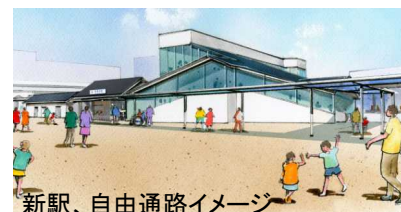
新駅、自由通路イメージ