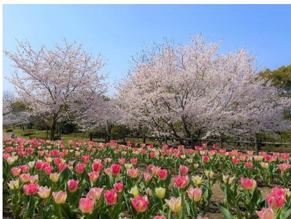
【北エリア／桜、チューリップ】