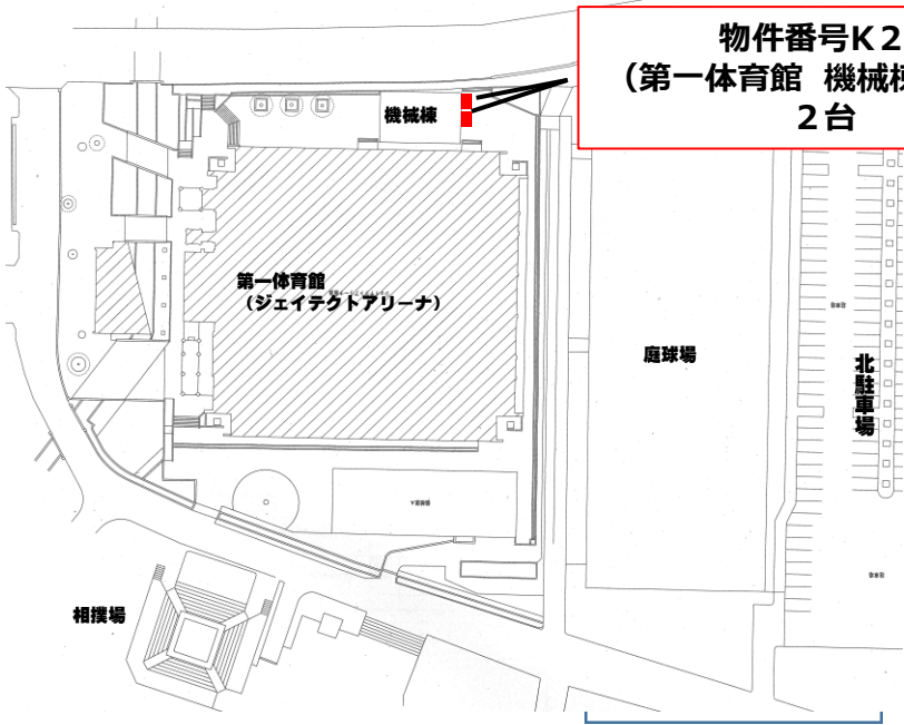
物件番号K2 (第一体育館 機械棟東側) 2台