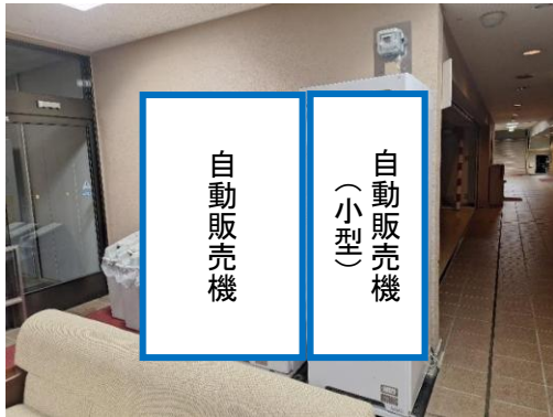
物件番号K1 (第一体育館 1階玄関ホール) 2台 (うち、1台は、小型用)