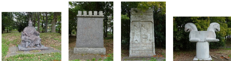
図 既存モニュメント

事業用地内に県が設置したモニュメント4体（下図）については、移設すること。移設先については、事業用地外の浄化センター敷地内とし、詳細な場所については協議により決定するものとする。