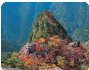
上北山村 大台ヶ原（大蛇岳）

冬の奥大和は、氷瀑や霧氷など、冬季限定の景観が楽しめます。地元ガイドの案内がないととどり着けない絶景ポイントやランチ＆温泉入浴付きツアーもあります。