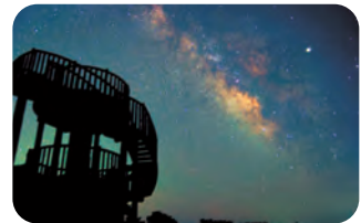
山添村 神野山山頂展望台