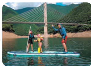
川上村 スタンドアップパドル (SUP)