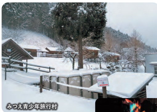
みつえ青少年旅行村

奥大和のキャンプは、オートキャンプ場でのテント泊だけでなく、グランピングやデイキャンプなど楽しみ方は多種多様。焚き火やBBQだけでなく、星空、雲海、紅葉など、季節ごとの楽しみも満載です。