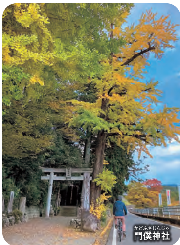
かどふさじんじの 門僕神社

右記3カ所で大人数用電動アシスト自転車を出中。村内の見どころや季節情報は、(一社)そののわGLOCALの公式HPや☎0745-94-2022まで。