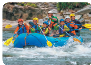
五條市 ラフティング

ケイビングガイドのもと、ヘッドライト付きヘルメット着用で冒険。子ども向け、または大人向けが選べます。