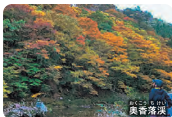
おくこう ち けい 奥香滝溪