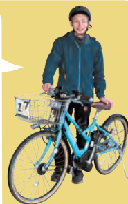
(一社)そののわGLOCAL 企画営業

曽爾村のゆったりとした空気感に惹かれて、数年前に移住してきました。レンタサイクルは宿泊者以外も利用可能ですが、ぜひ泊まってじっくりと名所をまわってください。曽爾高原は、2月～3月の山焼きや初夏の新緑の頃だと秋より混雑せずにゆっくり散策できますよ。関西でも特に遅咲きとして知られる標高700mの屏風岩公苑の山桜も見事。サイクリングの後は「お亀の湯」で汗を流すのもおすすめです。ススキの見頃(10月～11月)の週末は交通渋滞にご注意ください。