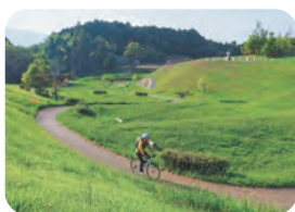
明日香村 キトラ古墳