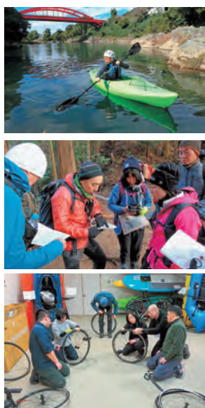
令和6年度の講習会の様子

奥大和地域におけるアウトドア・スポーツツーリズム推進の土台づくりとして、人材育成プログラムを実施。カヤック、トレッキング、サイクリングのインストラクター養成を目的とした講習会や検定を行い、アクティビティの担い手のスキルアップに取り組んでいます。