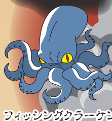
フィッシングクレーケン