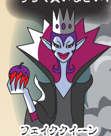
フェイククワイーン