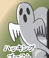
ハッキング ゴースト