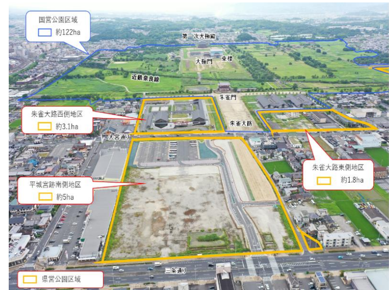
(平城宮跡歴史公園 航空写真)