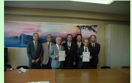
生駒市鹿ノ台地区&香芝市真美ヶ丘地区 のみなさん