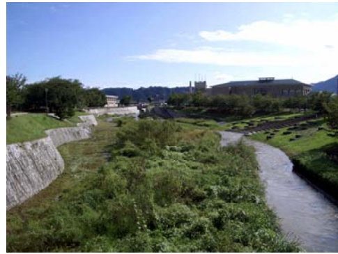
葛城川（御所市役所前）