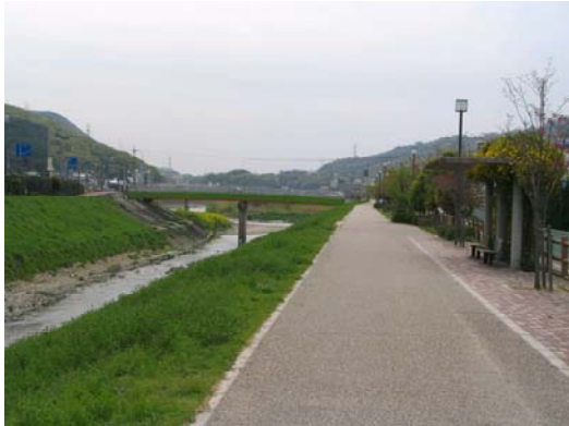
葛下川（王寺町役場前）