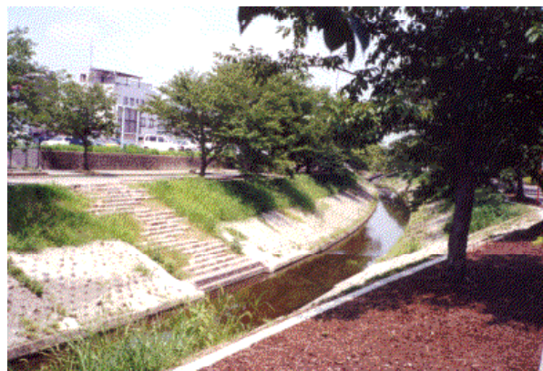
高取川（榎原市白檀町）