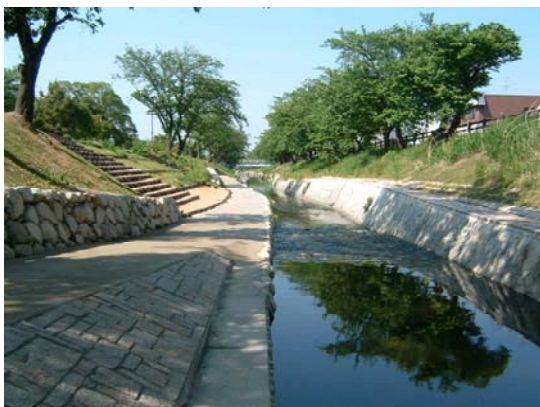
高田川（大中公園横）

本圏域では、高田川、高取川において住民と川づくりについての懇談会を設け、住民の意見を反映した川づくりを進めている。