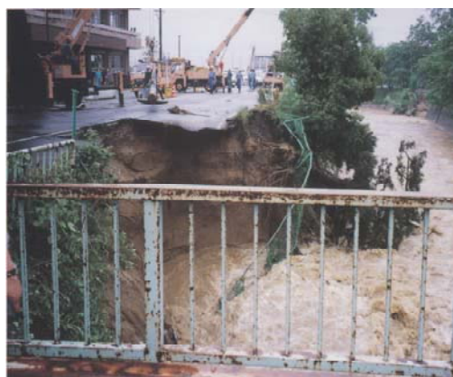
平成7年7月洪水(御所市役所前)