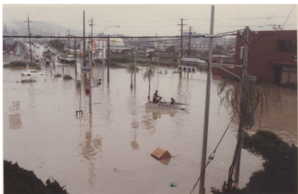
昭和57年8月洪水(王寺町役場屋上から)