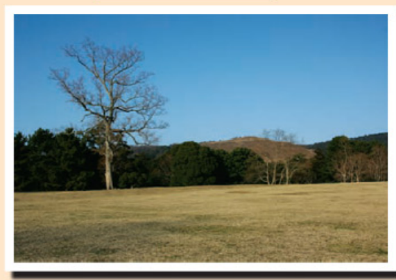
小川先生が鹿から指示を受けた重要な場所。ドラマで最も多く取り上げられた。

◇大仏殿・法華堂・戒壇堂入堂時間 3月：8：00～17：00 4～9月：7：30～17：30 10月：7：30～17：00 11～2月：8：00～16：30 ◆問合せ先：0742-22-5511