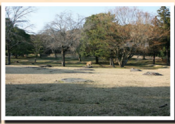
講堂跡：この礎石に玉木宏扮する小川先生が腰掛けていた