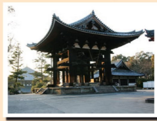
鐘楼：奈良女学院への通学路