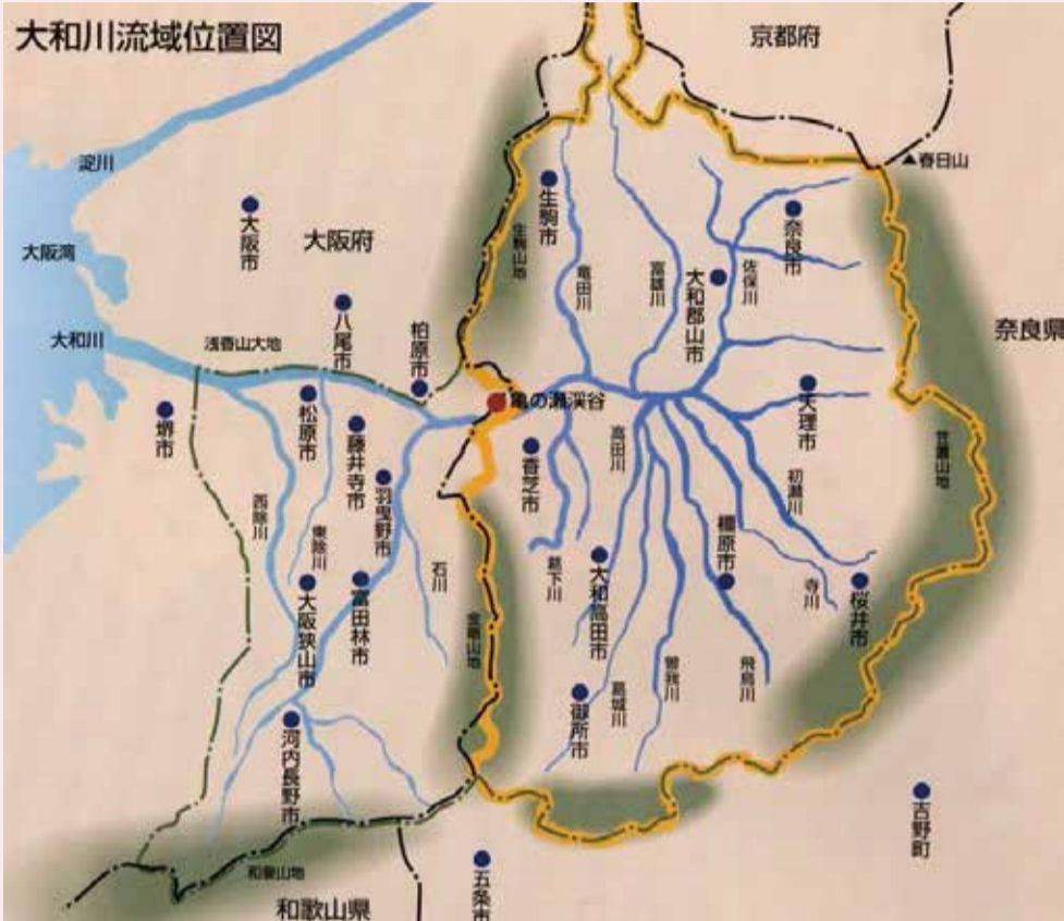
大和川流域位置図

昔と比べると、大和川はとてもきれいになりましたが、支川の中には まだ汚れている川もあります。