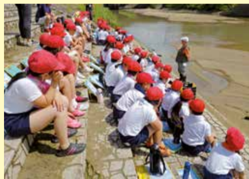
お話を聞いた後、いよいよ川に入ります。

生き物に詳しい先生から、川にまつわるお話や、水辺にすむ生き物の探し方などについてお話を聞きます。安全に観察するためにも、しっかりとお話を聞きましょう。