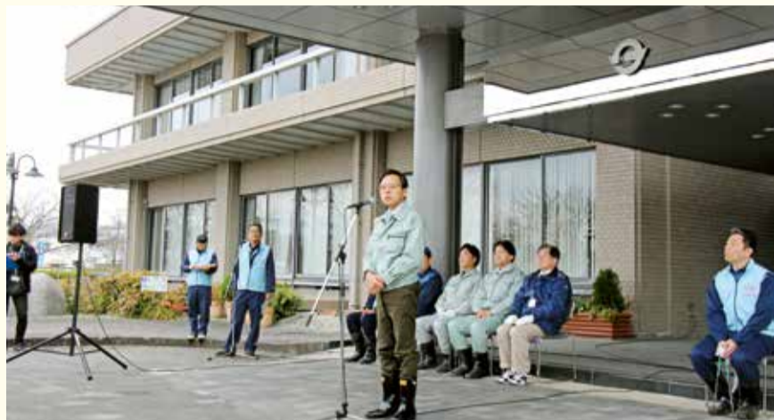
メイン会場 (田原本町・寺川)

田原本町長はじめ、奈良県副知事、国土交通省近畿地方整備局河川部長等が出席しました。