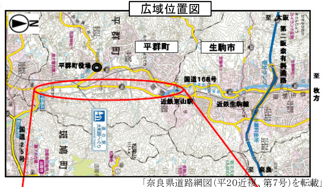
「奈良県道路網図(平20近復、第7号)を転載」