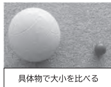
具体物で大小を比べる