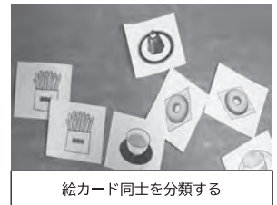
絵カード同士を分類する