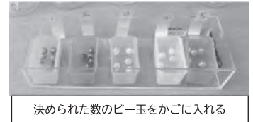
決められた数のビー玉をかごに入れる