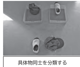
具体物同士を分類する