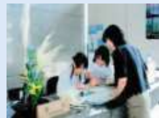
行政インターンシップ