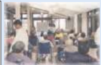
ボランティア体験