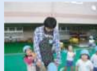
幼児との交流体験