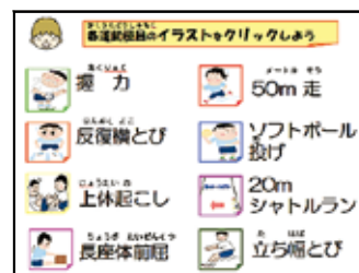
新体カテスト指導コンテンツ