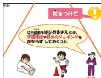
プレゼンテーション教材