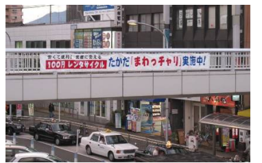
横断幕による現地PR