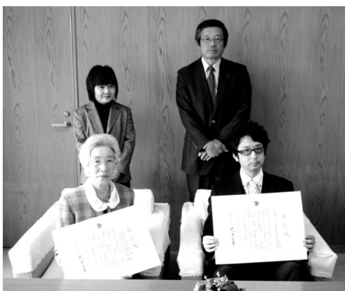
前列左から 三郷サンサンハウス、アイ・ピー・ファイン株式会社

奈良県では働きやすい職場づくりを推進するために、積極的に職場づくりに取り組んでいる企業に対して「奈良県社員・シャイン職場づくり推進企業」への登録をお願いし、その企業の取組を紹介することで働きやすい職場を広げていく事業を展開しています。