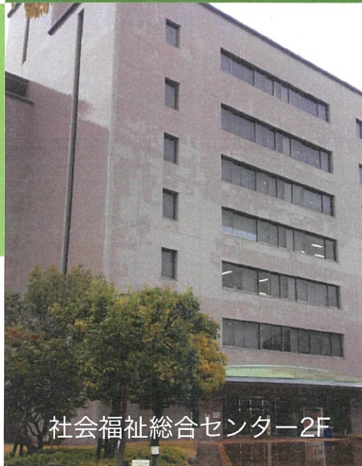
社会福祉総合センター2F