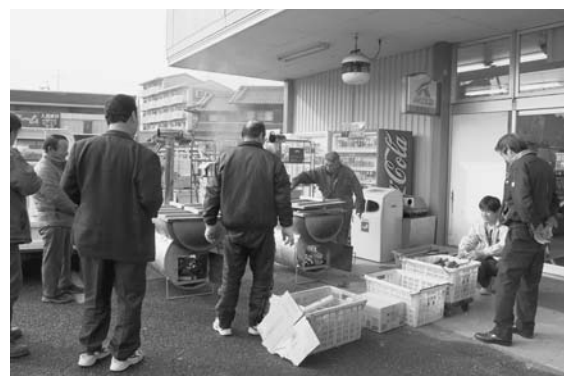
手作りの「やきいも機」

天理市生活改善グループ連絡会は、地産地消活動を進める中で地域の伝統の料理や、ふるさとの味、大和の味を伝えようと、販売している旬の野菜を使った料理の試食による紹介をしています。この日はキャベツを使った料理の数々と昔よく食べられていた料理「おみい」。大和では、「おみ」「おみい」と地域によって呼び方は異なりますがサトイモ、ダイコン、ニンジン、ゴボウなどの根菜類を使った味噌汁にご飯やそうめんを入れたみそ雑炊です。ミズナや油揚げ、シイタケなど旬の野菜や土地の特産物を入れます。寒い季節の食べ物として、また残り野菜の上手な利用法として各家庭ごとに工夫して食べられたようです。このような先人の知恵なども朝市のふれあいの中で伝えると共に旬の野菜の料理の仕方などをレシピにして配布するなど、消費者との交流にほのぼのとした暖かさを添えています。