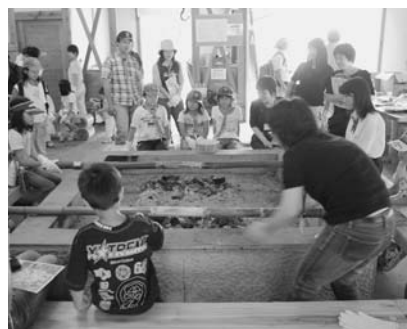
バームクーヘン作り