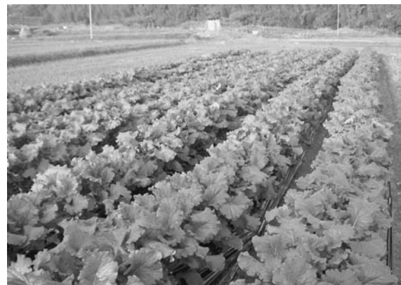
転作振興作物の一例・ナバナ

担い手以外の生産者に対して、米価下落時の影響を緩和するための支援等を行うためのものですが、地域であらかじめ取り決めることにより、財源の一部または全部を産地づくり交付金に融通することが可能です。