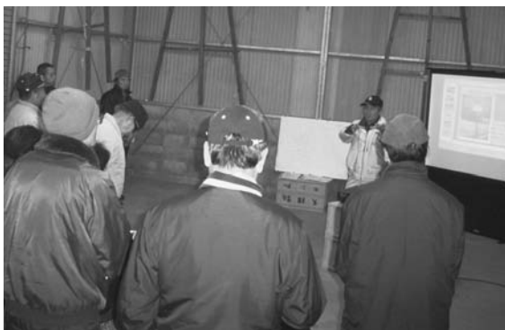
県果樹振興センター 福井総括研究員の講演

イノシシは夜行性ではありません。警戒心が強いため、人気の少ない夜に行動しているだけです。1mは楽に飛び越えますので、柵にも一工夫あります…などなど、イノシシについての知識や、なぜ増えているのかということをご皆さんに学習してもらいました。