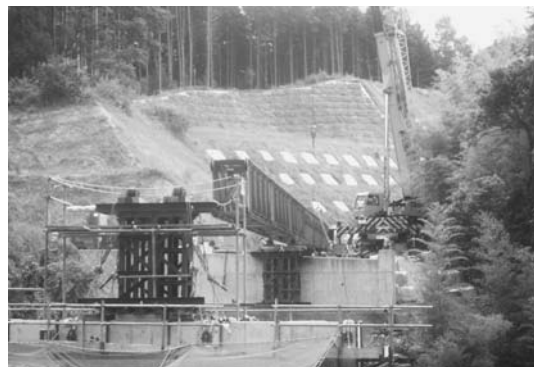
ガーダー引き出し