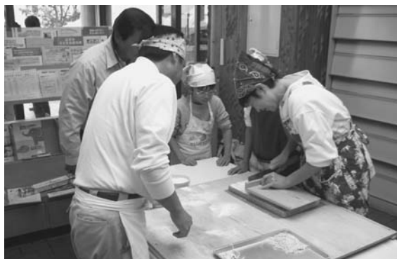
産業フェスティバル そば打ち体験

そばは一度に花が咲くのではなく、下の方から徐々に咲いてくるので、そばの収穫期の判断が難しかったのですが、子実の90%程度が黒変した11月7日に刈り取りを行いました。収穫はJAの汎用コンバインで一気に刈り取りました。天候にも恵まれ、病害虫被害もほとんどなく、予想を上回り、115kg/10aの収量がありました。