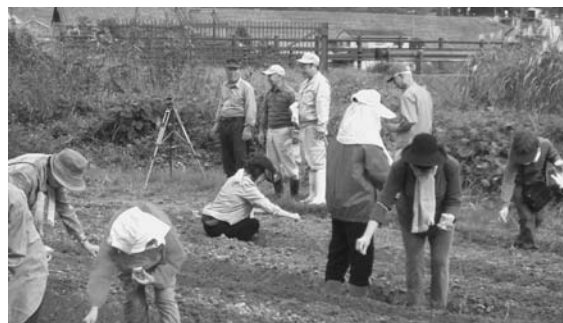
菜の花の播種作業

間引きや土寄せなど、真冬の作業が続きますが、プロジェクトのメンバーはこつこつと作業をこなし、菜の花は順調に生育しています。