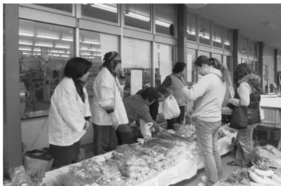
旬の野菜などを直売

平成19年2月9日の朝市では、天理市内の農家や家庭菜園などを営む市民で構成する天理地区直売部会と協賛し、とりたての野菜や手づくりの加工品を販売しました。