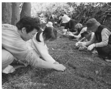
畑ワサビ植え付け