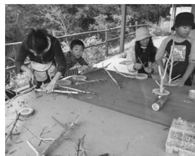
ヒノキのハンガー作り