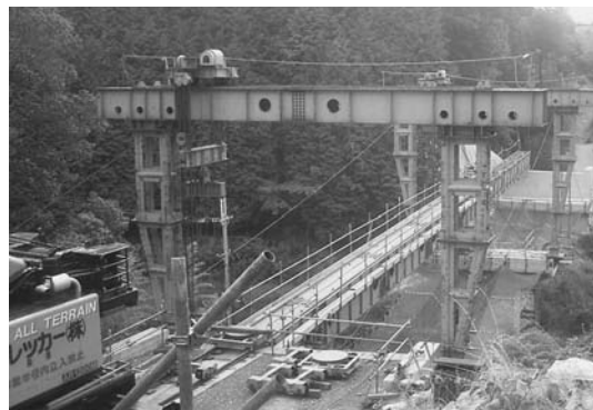
ガーダー架設完了