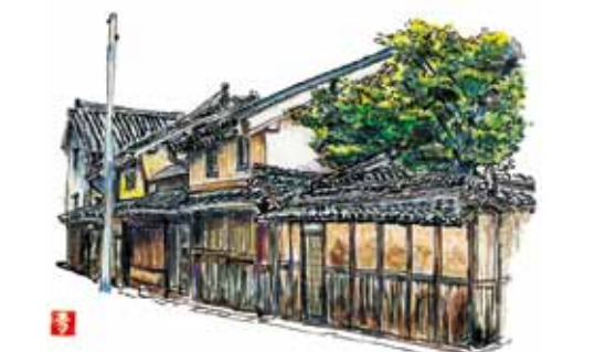
【田原本町 竹村本家】