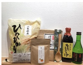
奈良まほろば餃子セレクト ～おうちで奈良を体験セット～