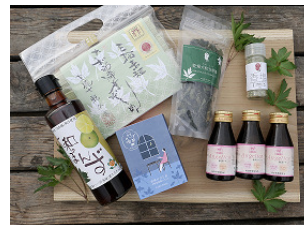
奈良県漢方プロジェクト 6点セット