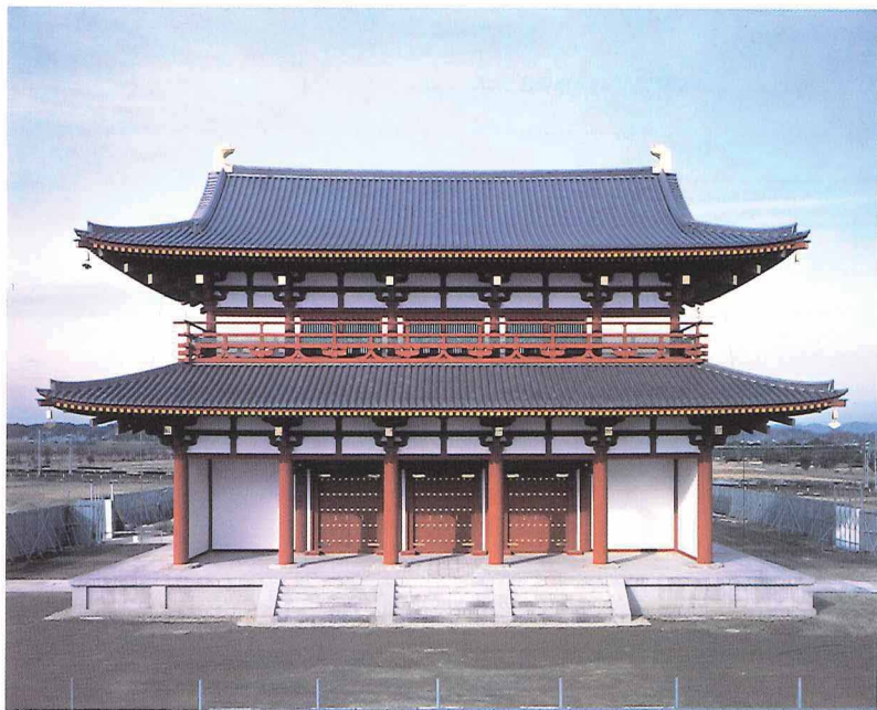
朱雀門 奈良国立文化財研究所許可済