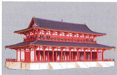
平城京第一次大極殿復原模型