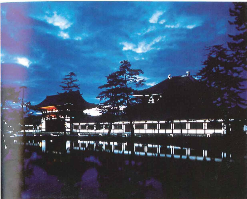
東大寺大仏殿 中門 回廊 (ライトアッププロムナード)