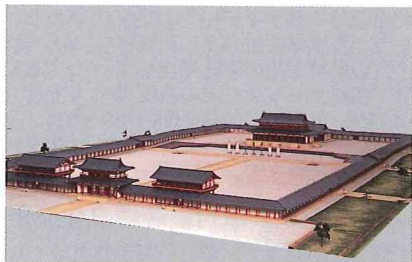
平城京第一次大極殿院復原模型

奈良県は、これから21世紀にかけて、人間性への回帰や自然志向の高まり、また多彩な交流が一層強く意識される中で、新しい世紀に力強く羽ばたく素晴らしい可能性に満ちています。奈良県新総合計画では、「世界に光る奈良県づくり」を基本目標とし、歴史、文化、自然といった本県の優れた特性を最大限に生かし、より大きな新たな魅力を創造して新しい時代にふさわしい個性と魅力に満ち、内外から注目されるような存在感のある地域となることをめざしています。今後その実現に向けて、県土の基盤整備、医療福祉、産業振興、国際文化観光、生活環境、人材育成、地域整備など各分野の施策を積極的に推進していきます。