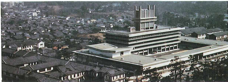
新旧県庁舎(昭和40年)

奈良県は、気候・風土に恵まれているものの、海が無く、河川に乏しいという条件もあっ