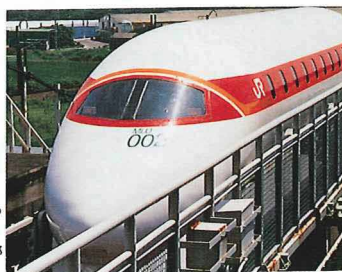
リニアモーターカー実験車両