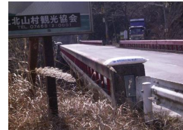
桑ノ瀬小谷橋(国道169号)