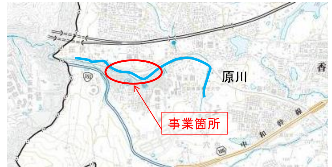
国土地理院の5万分の1の地形図を転載(奈良県高田土木事務所管内 (承認番号 平23近模 第54号))