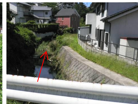
事業予定箇所上流地点 (下流向き)