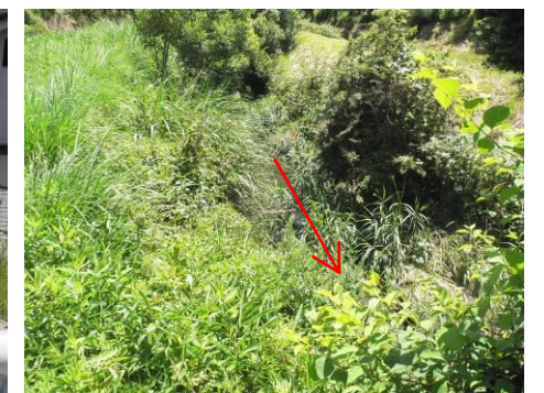
事業予定箇所上流地点 (上流向き)