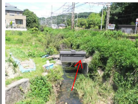
事業予定箇所下流地点 (下流向き)