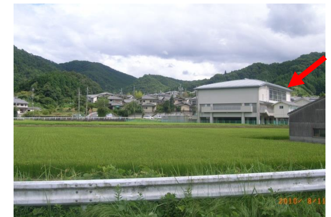
避難施設 吐山小学校