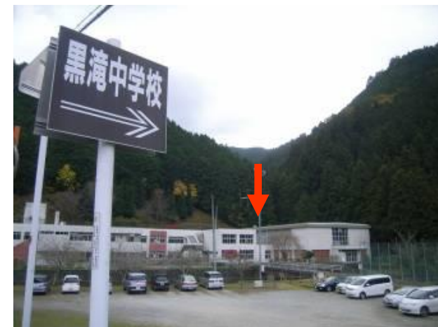
避難施設 黒滝中学校