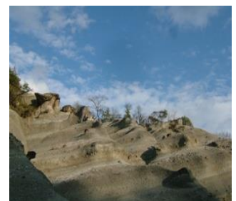
県天然記念物 屯鶴峯(香芝市)

屯鶴峯も小規模ながら日本のカッパドキアとして、また金剛生駒紀泉国定公園の金剛葛城山系の稜線を縦走する長距離自然歩道(ダイヤモンドトレイル)の出発点として、景観・自然・防空壕等をPRすることにより素晴らしい観光資源として全国に発信できると考える。