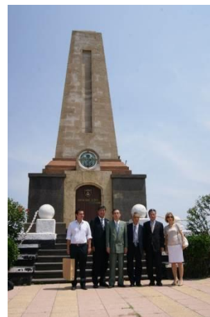
メルシン市の海難慰霊碑

日本とトルコの交流の歴史を目の当たりにし、交流や友好の重みを認識したところである。また、メルシン市と串本町の交流のすばらしさを聴取し地方自治体同士の交流の大切さを実感した。