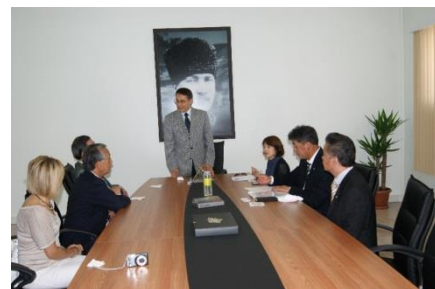
テウンチュス副市長と会談