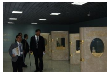
イエニカプ駅構内には、駅舎建設時に出土した遺物の模型が展示されている。

ボスポラス海峡の厳しい自然環境のための工法変更や4つの駅建設にかかる歴史的な文化財の発掘・保存やそのための軌道変更により、56ヶ月の工期が110ヶ月に変更になり、工事費も1,023億円から約1,500億円に増額となった。しかし結果的には、それ以上の経済効果が見込めることは明らかである。