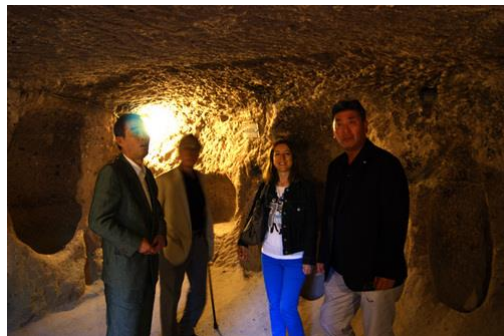
世界遺産カイマクル地下都市を視察

奈良を訪れた外国人は2012年は28万5千人だったが、2013年は45万6千人に増加している。2014年も大幅に増える予測とのことであるが、今年度開催した「大古事記展」のように自治体が積極的にイニシアティブを取ることが重要と考える。