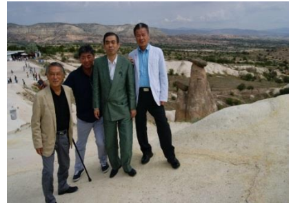
世界遺産 カッパドキア

カッパドキアは100km近くにわたって岩石地帯が広がり、キノコや煙突のような形の奇岩が林立し、巨岩がそびえるその景観は自然の驚異と言える。カッパドキアの熱気球を活用した観光は絶賛に値し、数多くの洞窟を利用して建築した洞窟ホテルは地形をそのまま利用し観光客に人気である。ギョレメ野外博物館研究員から世界遺産の保護と活用についてのレクチャーを受け、県内の景観地の保護と活用についての示唆を受けた。