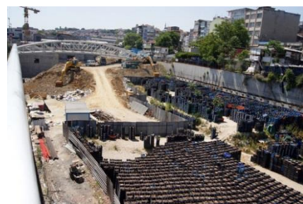
イエニカプ駅遺跡保存現場